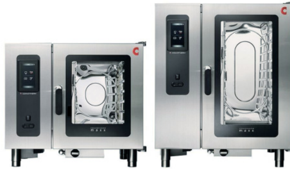
Convotherm Kombidämpfer