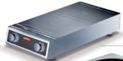
FLEX Base dual